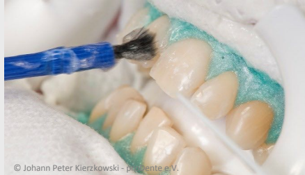
Power-Bleaching beim Zahnarzt: Auftragen des Bleaching-Gels

Wenn Sie die Praxis wieder verlassen, können Sie sich an sichtbar helleren Zähnen freuen!