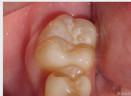
Schutz vor Karies: Versiegelung der feinen Grübchen auf der Kaufläche

Bei der Versiegelung werden die Fissuren mit einem hellen Kunststoff dauerhaft verschlossen, so dass an diesen Stellen keine Karies mehr entstehen kann (siehe Abb. unten).