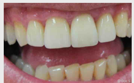
Veneers der oberen vier Schneidezähne 12 Jahre (!) nach dem Einsetzen. Es sind keinerlei Beläge vorhanden und das Zahnfleisch ist gesund.

Wenn Sie sich schon lange ein perfektes Lächeln wünschen, dann sprechen Sie uns an!